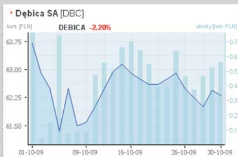
Goodyear chce zapłacić za Dębicę mniej, niż wynosi rynkowa cena.

Bohaterem października na GPW była oponiarska Dębica. Powód – ogłoszone przez amerykańskiego Goodyeara wezwanie do sprzedaży ponad 34 proc. akcji spółki. Zaskoczeniem było nie same wezwanie, ale jego cena – 59,52 zł za akcję, sporo niższa od rynkowej. Wezwanie ma potrwać do 12 listopada, jednak komentatorzy są zgodni, że po tej cenie Goodyear nie kupi zbyt wielu papierów.